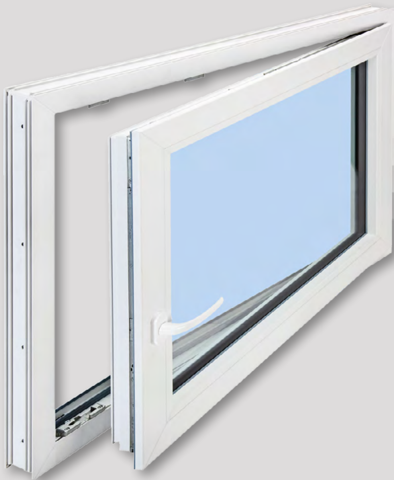
MEALON Dreh-Kipp Komfort: 5-Kammer-Profil (70 mm Rahmenstärke), Wärmeschutzglas, U_g = 1,1 \text{ W/m}^2 \text{ K} ( U_w = 1,3 \text{ W/m}^2 \text{ K} )