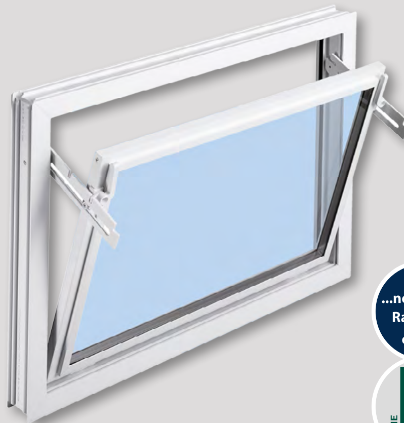
MEALON Kipp-Fenster: wahlweise mit Isolierverglasung 14 mm ( U_g = 3,3 \text{ W/m}^2 \text{ K} ) bzw. 24 mm ( U_g = 3,0 \text{ W/m}^2 \text{ K} ) oder Einfachverglasung ( U_g = 5,6 \text{ W/m}^2 \text{ K} )

Das MEALON Kunststoff-Fenster ist ein Allrounder für das Untergeschoss: Die hochwertige Premium-Variante lässt zuverlässig Licht in wohnliche Nebenräume wie Gäste- oder Arbeitszimmer. Für unbeheizte Räume wie die Hobbywerkstatt oder das Gartenhaus empfehlen sich besonders die Kipp-Fenster.